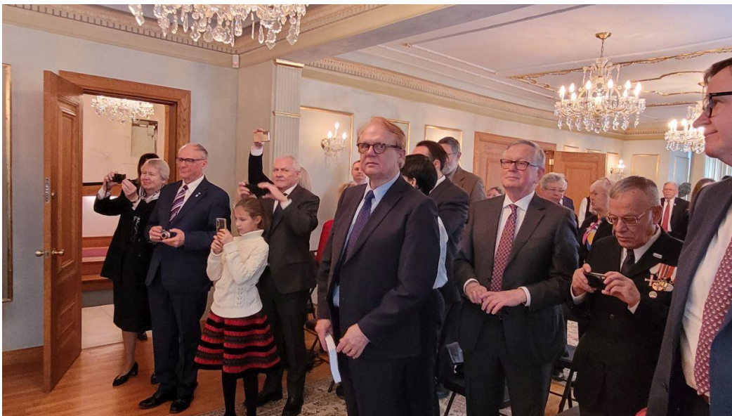
Salon Ambasady RP podczas uroczystości 2 II 2024