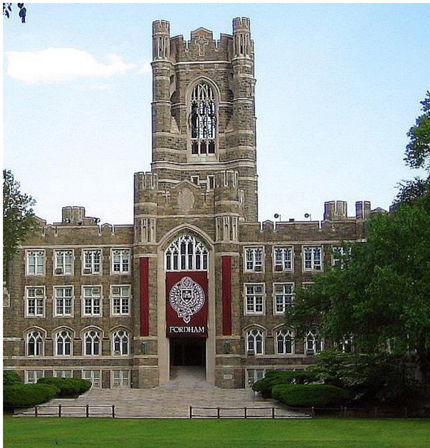
Keating Hall, Fordham University, stan Nowy Jork

Miejsce pracy prof. Oskara Haleckiego w latach 1944-1973 - Wikipedia