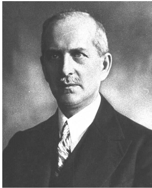
Prof. Florian Znaniecki (1882-1956), światowej sławy socjolog, twórca nowoczesnej socjologii, tworzył w USA od 1939