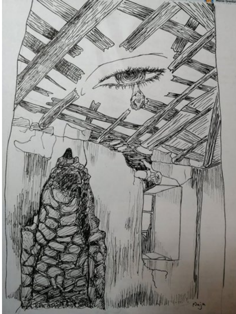
Maja Konopińska, uczennica kl. 10 z Ottawy – rysunek piórkiem na podstawie wiersza C. K. Norwida – W Weronie