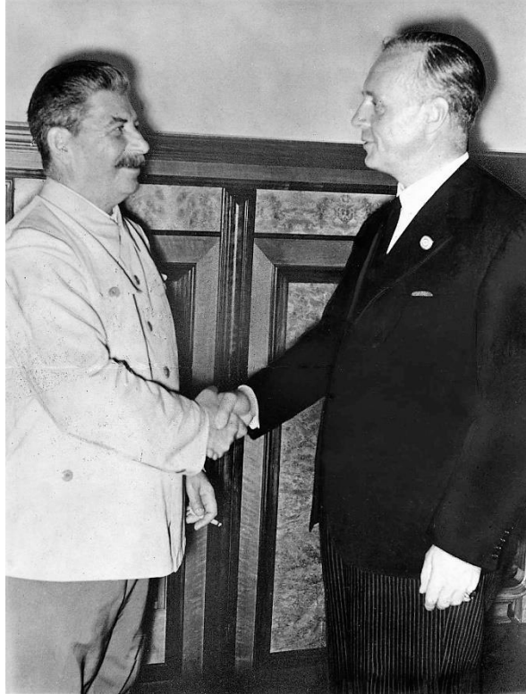
De g. à d. J. Staline et J. von Ribbentrop, après la signature du Pacte de non-agression nazi-soviétique au Kremlin, à Moscou, le 23 août 1939.)

Le Pacte Molotov-Ribbentrop est le nom courant du traité signé par les ministres des Affaires étrangères soviétique, Vyacheslav Molotov, et allemand, Joachim von Ribbentrop.