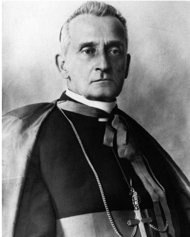
Książe Adam Stefan Kardynał Sapieha, Arcybiskup Metropolita Krakowski (1867 - 1951)

wartościom fundamentalnym, które wyznawał. Centralnym punktem Jego nauki była relacja człowieka z Bogiem.